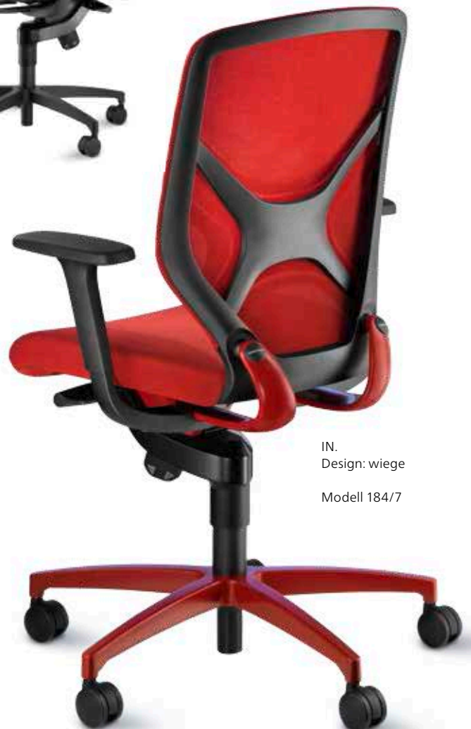
IN. Design: wiege Modell 184/7